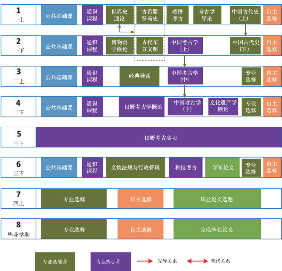
考古学专业课程地图